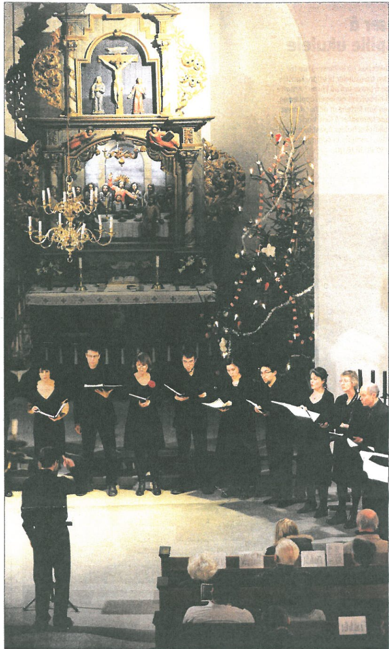
JULESANG: Asker kammerkor tok publikum i Asker kirke med på en musikalsk reise i Nord-Europas vakre julemusikk.

– Koret består av helt vanlige folk, men jeg vil påstå at de hol-