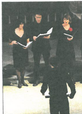
Asker kammerkor tok tilhørerne med på en musikalsk reise i Nord-Europas vakre julemusikk under sin konsert i Asker kirke.