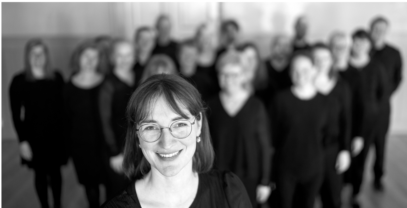
Asker kammerkor 2023